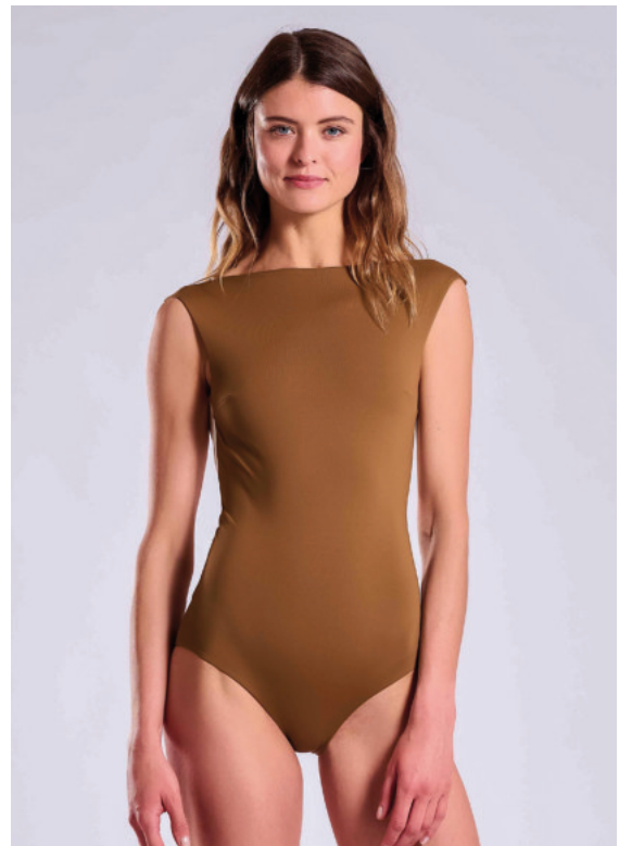
Hochwertige Bademoden wie von Myrardini stehen ebenfalls hoch im Kurs

Geklappt hat es übrigens schon ein Jahr nach der offiziellen Eröffnung der Lingerie am Meer mit dem