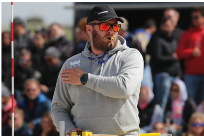
Die Sportereignisse versprechen wie jedes Jahr höchste Spannung.