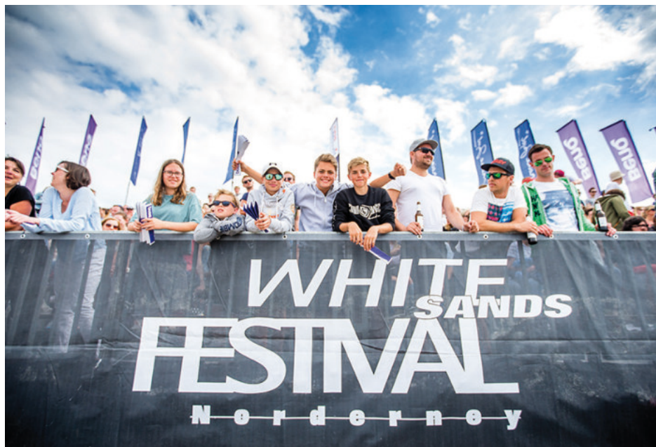
White Sands auf Norderney: Die Vorfreude steigt.

Norderney - Traditionell wird an Pfingsten auf Norderney gebaggert, gepritscht und gefeiert. Vom 26. bis 28. Mai trifft beim White Sands Festival wieder Spitzensport auf exklusive Party's.