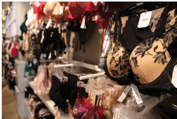
Ausgewählte Unterwäsche und Dessous gibt es im Fachgeschäft in der Bismarckstraße.

Monate, um wieder auf die Beine zu kommen. „Aber ich wollte ins Leben zurück. Dafür habe ich gekämpft. Ich war damals verheiratet und hatte ein Kind.“ Inzwischen hatte sie ihren Job aufgegeben, was ihr seinerzeit alles andere als leichtgefallen sei. Auf der Insel habe sie dann jedoch schnell wieder zur Ruhe gefunden. „Und dann kam Christa. Sie gab mir Rückhalt.“