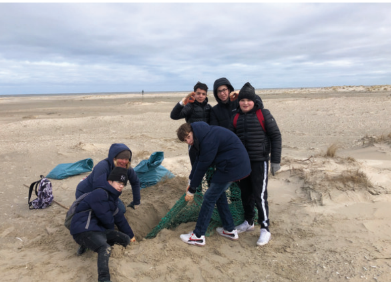
Große (Müll-)Beute: Schülerinnen und Schüler der KGS Norderney haben im Inselosten einmal mehr ganze Arbeit geleistet.

Norderney - Normalerweise findet die Strandreinigung des Bundes für Umwelt- und Naturschutz (BUND) und Kooperativer Gesamtschule (KGS) im September zum internationalen Coastal Clean-up Day statt. Doch am besagten Tag war der Wind zu stark gewesen - und die