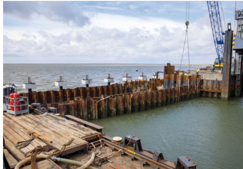
Die Arbeiten sollen Ende 2023 abgeschlossen sein.

Ursprünglich für letztes Jahr eingeplant, musste die Maßnahme zugunsten des LNG-Anlegers in Wilhelmshaven zehn Monate pausieren. Ende März 2023 ging es an der Südmole weiter. Seitdem ist viel passiert: Ein Teil der alten Mole wurde schon zurückgebaut, parallel hat der Neubau begonnen. Über einen Arbeitsponton wurden die ersten Stahlpfähle für die neue Konstruktion eingebracht. Auf einige dieser Pfähle wurden die ersten Beton-Fertigteile aufgesetzt. Zudem wird der