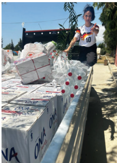
Unsägliches Leid auf der einen Seite und berherzte Hilfe andererseits.