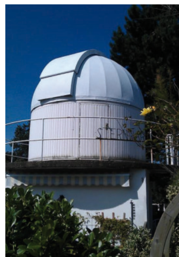
Die kleine Inselsternwarte geht auf eine Privatinitiative zurück und vermag spannende und bleibende Eindrücke zu vermitteln.

Anmeldung unter Tel.: 0176/24928209 zwingend erforderlich.