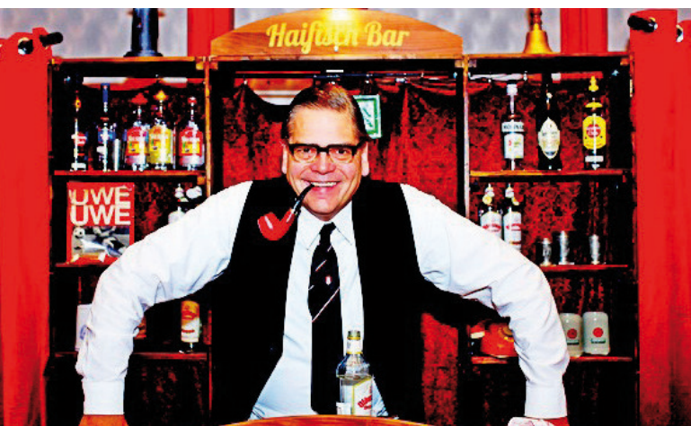
Kriminell-humorvolle Energie wird im November beim Stiftermahl auf Norderney versprüht.

Norderney – Eine kriminell gute Idee: Am 11. November 2023 veranstaltet die Norderneyer Bürgerstiftung die fünfte Ausgabe ihres Stiftermahls. In diesem Jahr haben sich die Akteure dafür ein besonderes Arrangement einfallen lassen: Das Stiftermahl soll als Krimi-Dinner im Weißen Saal des Conversationshauses in größerem Rahmen über die Bühne gehen.