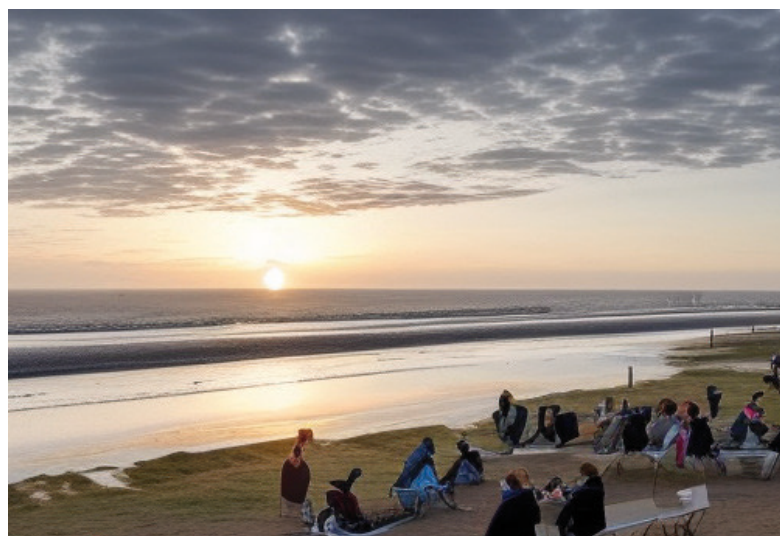
Die Aufforderung an die KI, eine Szene am Norderneyer Strand als Bild zu kreieren, lässt noch sehr zu wünschen übrig.

Eine kleine Replik, wie sie vollständig auf der Internetseite der Stadt Norderney ( www.stadt-norderney.de ) nachzulesen ist und auf Angaben des Stadtarchivs beruht, lohnt sich: Norderney wurde 1815 Teil des Königreichs Hannover. Das Kurhaus wurde sieben Jahre später neu erbaut und bereits 1840 erweitert. „Von 1836 bis 1865