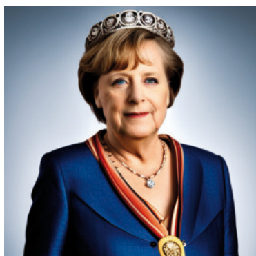
Die neue bayrische oder britische Monarchin?

Dieser Spitzname stammt aus der Zeit, als Norderney noch eine wichtige Station für den Post- und Warenverkehr war. Die Post wurde mit Brandgänsen befördert, die in speziellen Körben transportiert wurden. Man sagt, dass die Inselbewohner so viele dieser Gänse gegessen haben, dass sie selbst den Spitznamen „Brandgänse“ bekamen. Heute ist der Spitzname eher ein liebevoller Ausdruck für die Einwohner der Insel.